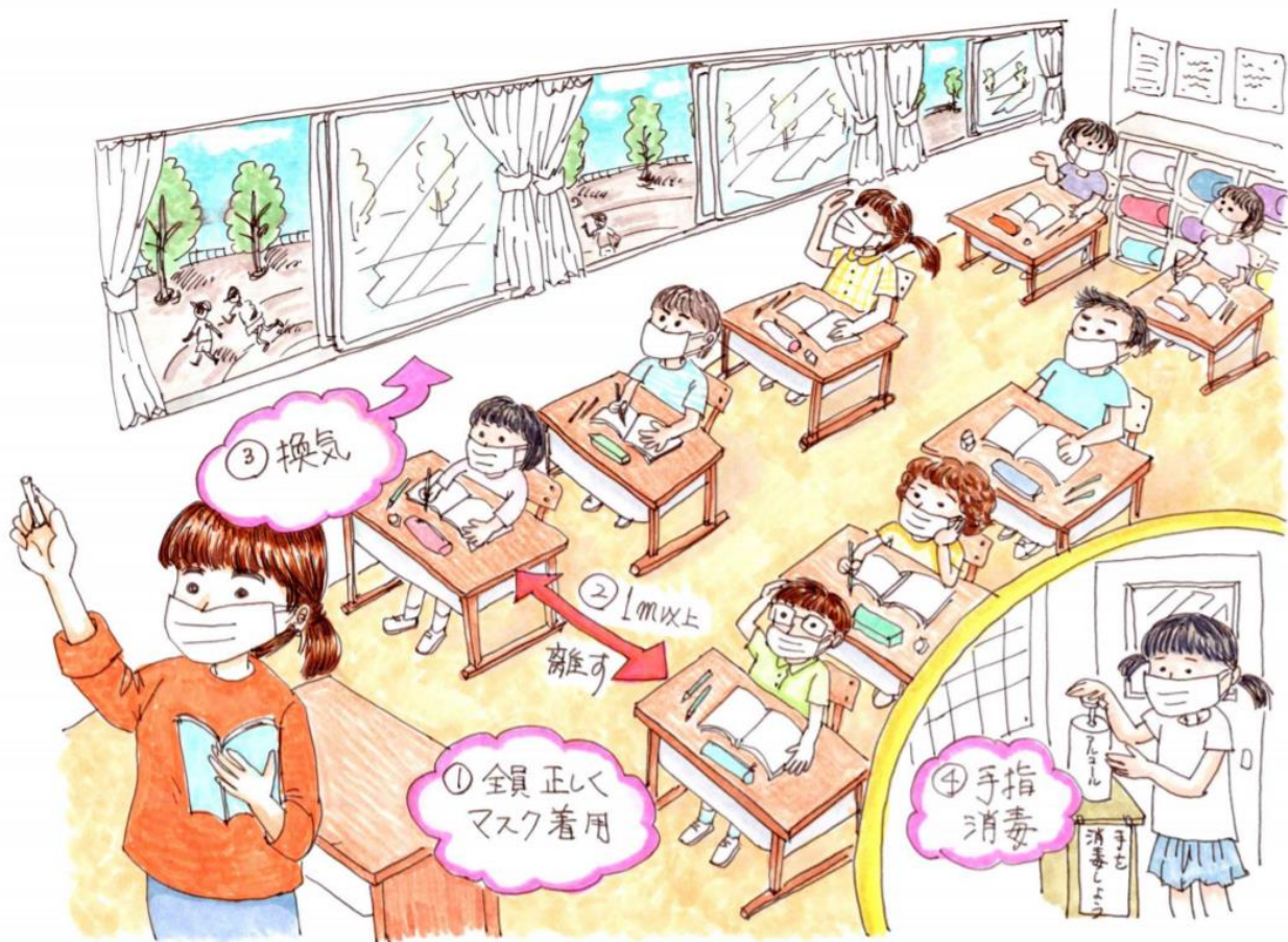
図6. 新型コロナウイルスに感染しにくい学校

図中の①②③④を徹底する。特にマスクの正しい着用は最も重要。(絵:ながせ えみこ)