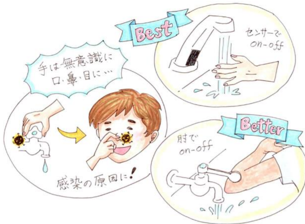
図5. 水道の蛇口の栓の種類による感染リスク

水道がないときは、70~80%アルコールで手指消毒しましょう。尚、 マスクをしていれば、手で口・鼻の粘膜を触ることはできませんので接触感染の予防にもなります。