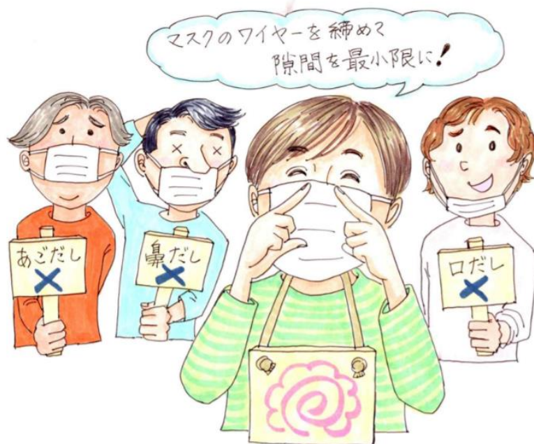
図3. マスクの正しい着用。口だし、鼻だし、あごだしはダメ。ワイヤーを締めて隙間を最小限に。