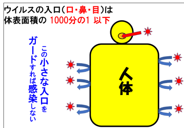
図 1. ウイルスの入口は狭い

目の面積は体表面積の 1000 分の 1 以下) (図1) からしか感染しませんので、感染予防の要(かなめ)は口・鼻・目の粘膜にウイルスを付けないことです。感染者の咳・くしゃみ、会話、歌唱などにより、ウイルスを含んだ大小の飛沫が口(一部は鼻)から飛び出します。それを口・鼻から吸い込んだり、目に付着すると感染するリスクがあります(飛沫感染)。